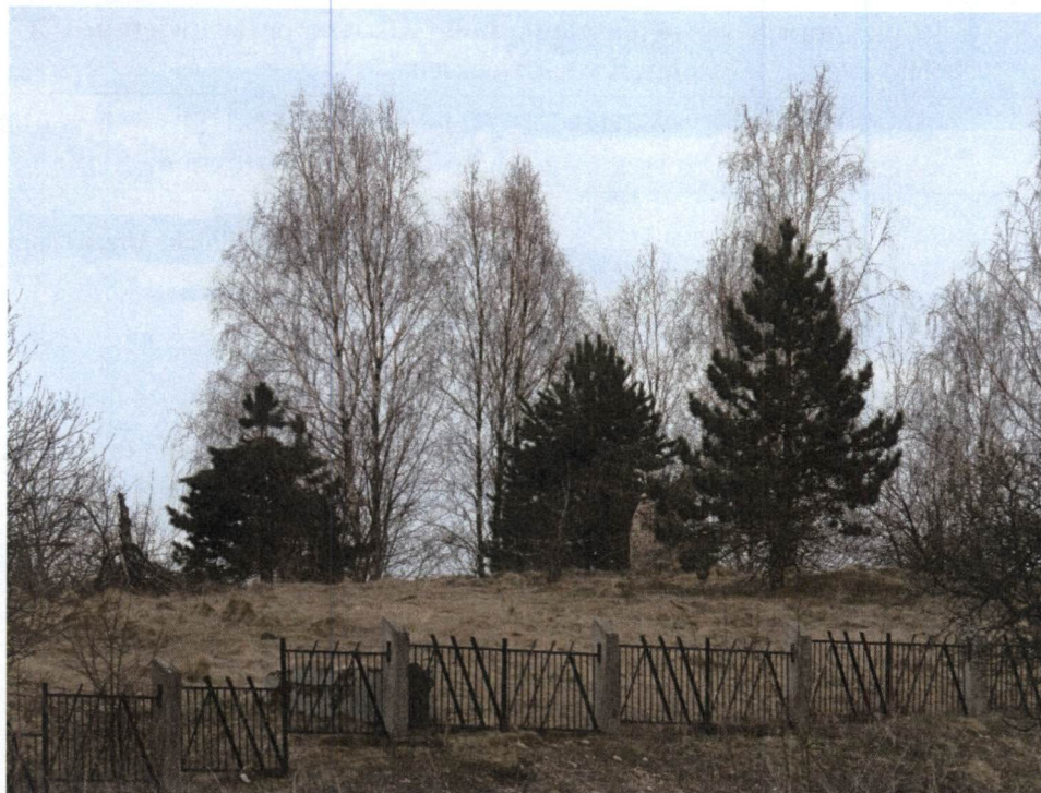
Kuźnica, cmentarz żydowski