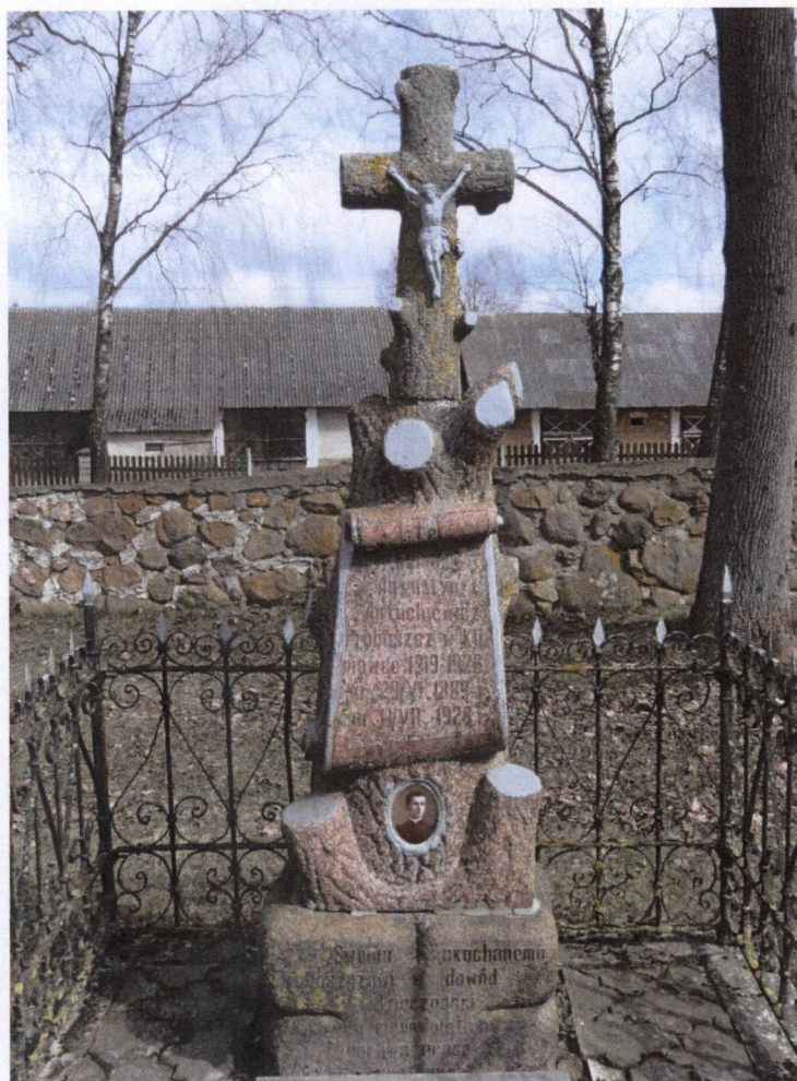
Klimówka, cmentarz przykościelny