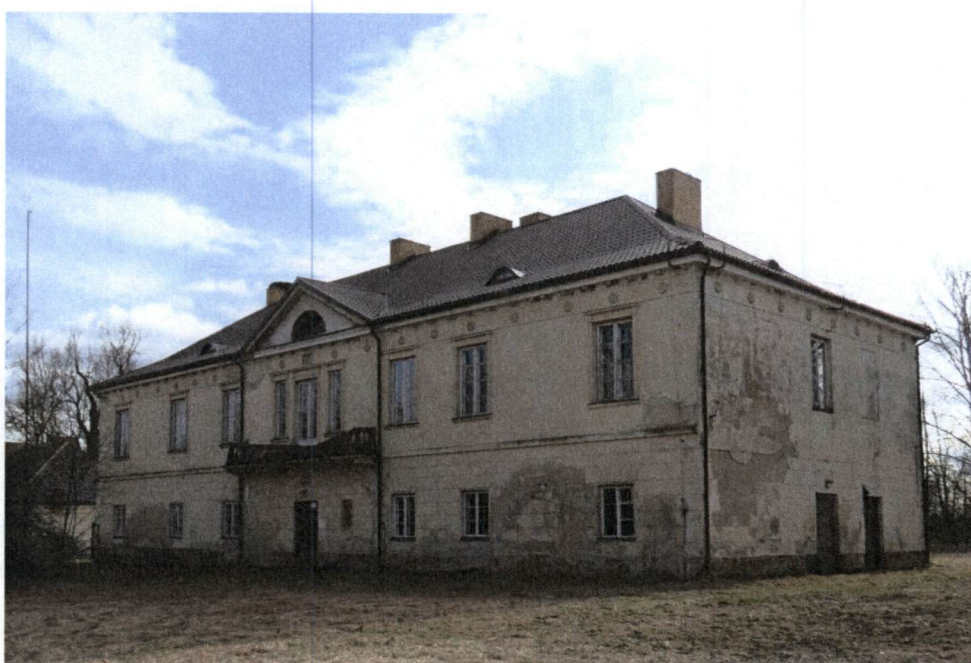
Pałac w Pawłowiczach, elewacja frontowa

Na terenie gminy znajdują się dwa wybitne obiekty z tej kategorii – pałac wraz z założeniem parkowym w Pawłowiczach oraz drewniany dwór w Łosośnej Małej.