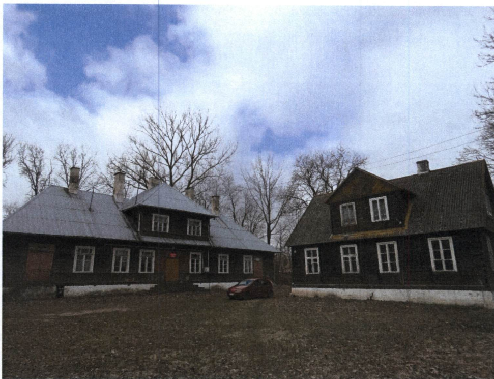
Zespół szkoły podstawowej w Popławcach. Po lewej budynek szkolny, po prawej dom nauczyciela

Tuż po zakończeniu II wojny światowej w miejscu gdzie przed II wojną światową znajdował się budynek szkoły (rozebrany podczas wojny) rozpoczęto budowę nowego budynku szkolnego z materiałów rozbiórkowych sokólskich koszar. Nauczanie ruszyło 1 września 1949 r. Szkoła Podstawowa w Popławcach została zamknięta w 2008 r. i od tego czasu budynku nie są użytkowane.