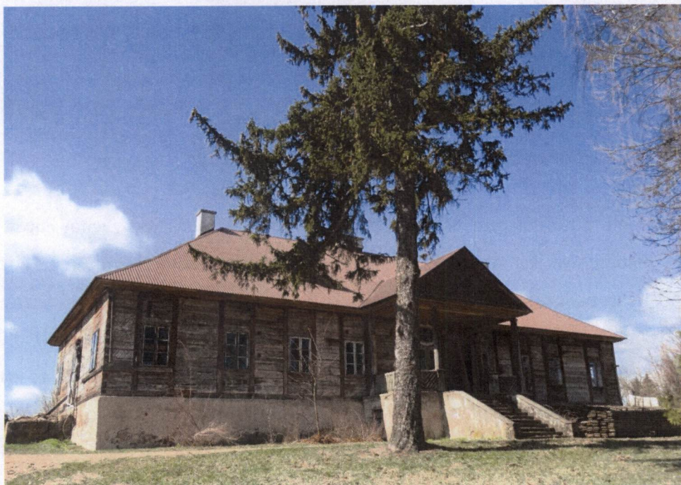
Drewniany dwór w Łosośnej Małej

Dwór wzniesiony w stylu nawiązującym do architektury barokowej, rozplanowany na rzucie prostokąta, posadowiony na wysokiej podmurówce, wzniesiony z drewna w technice sumikowo-łątkowej, jednokondygnacyjny, przykryty czterospadowym dachem. Elewacja frontowa dziewięcioosiowa z otworem drzwiowym w piątej osi, poprzedzonym otwartym gankiem na czterech kolumnach. Ganek zwieńczony trójkątnym szczytem, oszalowanym pionowo deskami, przykryty dwuspadowym daszkiem.