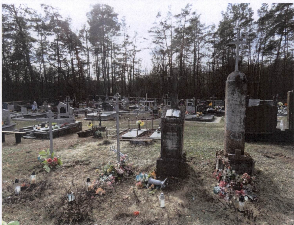
Kuźnica, cmentarz prawosławny, parafialny