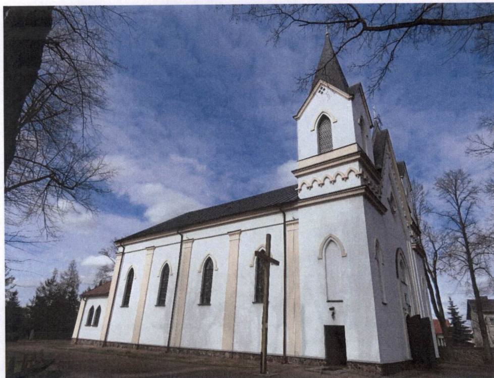
Kościół parafialny pw. Opatrzności Bożej w Kuźnicy

Kościół parafialny w Kuźnicy wzniesiono w czasie powstania styczniowego, w latach 1863-1864, wg projektu opracowanego jeszcze w okresie zaboru pruskiego – 1795-1807. Gruntowny remont kościoła został przeprowadzony w latach 1913-1914. Pokrycie dachu wykonano z blachy ocynkowanej a wieże zwieńczono mosiężnymi kulami z krzyżami. Świątynia została częściowo zniszczona i spalona w 24 lipcu 1944 r. podczas ofensywy Armii Czerwonej.