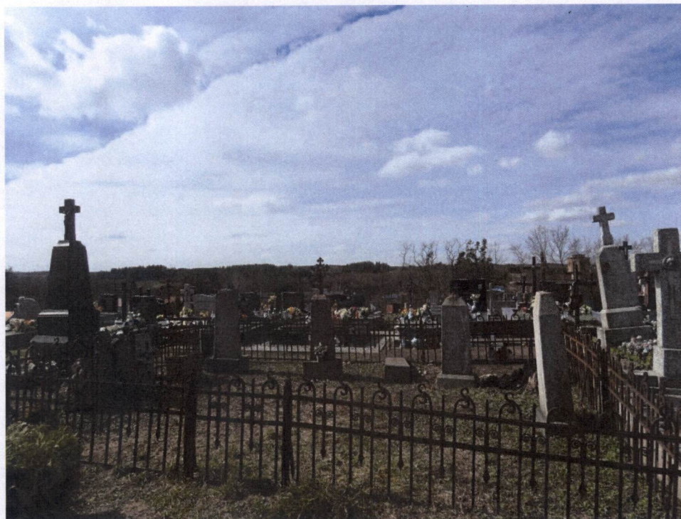
Kuźnica, cmentarz rzymskokatolicki, parafialny