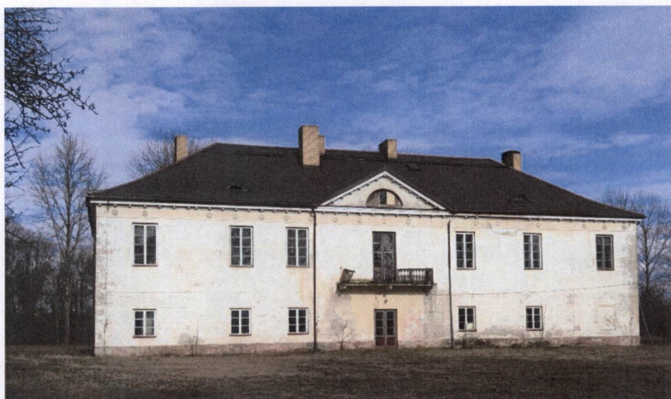
Pałac w Pawłowiczach, elewacja ogrodowa

czterospadowym z poderwanymi połaciami. Fasada ogrodowa w pierwszej kondygnacji siedmioosiowa. Otwór drzwiowy umieszczony w ryzalitowanej trzeciej osi. W drugiej kondygnacji dziewięcioosiowa. Osie od czwartej do szóstej ryzalitowane z otworem drzwiowym drzwi balkonowych w piątej osi. Kondygnacje rozdzielone prostym gzymsem kordonowym. Pierwsza kondygnacja – boniowana, druga zamknięta fryzem z tryglifów i rozet oraz profilowanym gzymsem wieńczącym. Wszystkie otwory zamknięte płasko, w pierwszej kondygnacji – niezdobione, w drugiej – z poziomymi naczólkami. Ryzalit zwieńczony tympanonem przykrytym trójkątnym daszkiem. Ściana szczytowa rozwiązana analogicznie, dwuosiowa w obu kondygnacjach.