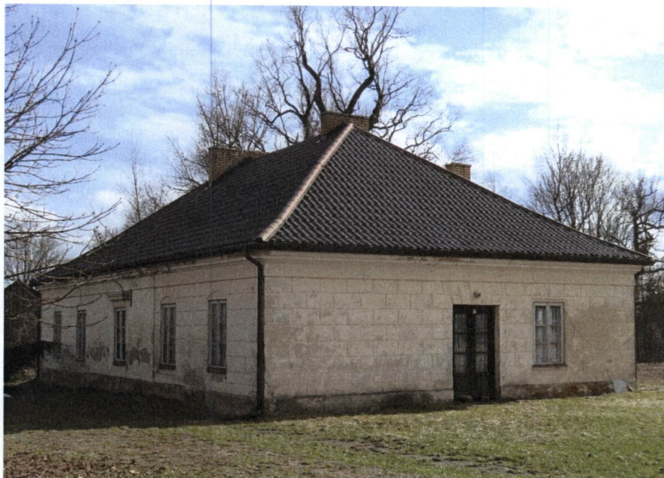
Pawłowicze, oficyna południowa

W skład zespołu poza pałacem wchodzi dwie oficyny. Północna jest zachowana w formie ruiny, zaś południowa jest w dobrym stanie, remontowana. Została wzniesiona w czwartej ćwierci XVIII w. podczas przebudowy wcześniejszego dworu na pałac klasycystyczny.