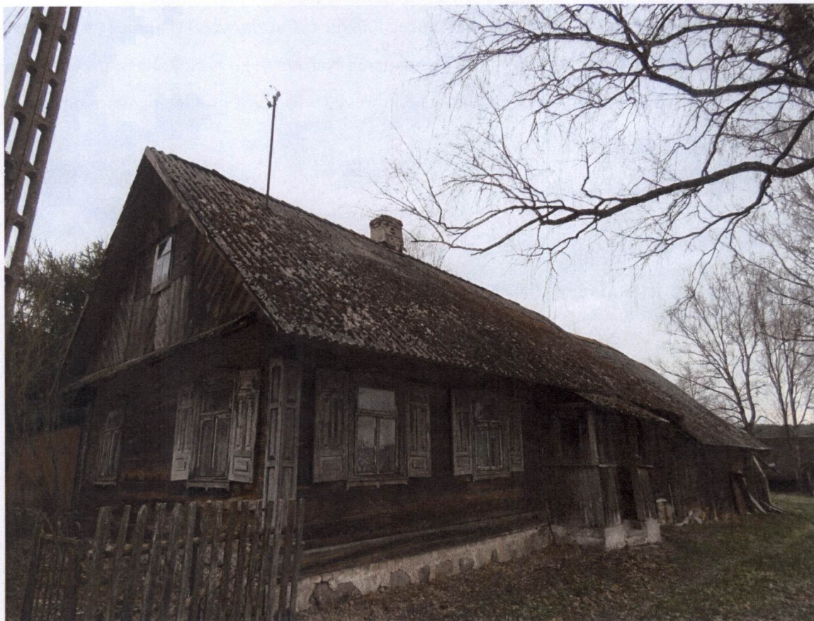
Dom drewniany we wsi Kowale