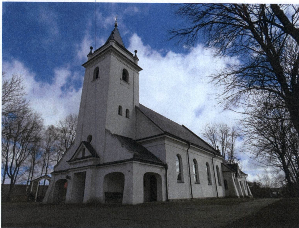
Kościół parafialny pw. św. Trójcy i św. Dominka w Klimówce

Kościół w Klimkówce powstał w miejscu wcześniejszej, drewnianej świątyni wzniesionej w 1656 r., która spłonęła około połowy XIX w. W miejscu spalonego kościoła w pierwszej połowie lat sześćdziesiątych XIX w. została wzniesiona murowana z kamienia kaplica, ufundowana przez właściciela dworu Tołoczki. Projekt przebudowy kaplicy na kościół, autorstwa Feliksa Michalskiego powstał w 1922 r. z inicjatywy ówczesnego proboszcza. Przebudowę zrealizowano w latach 1922-1928.